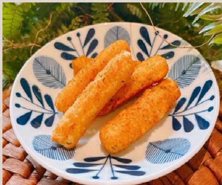
モッツアレラチーズ スティック ¥600