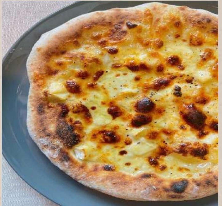
クアトロフォルマッジオ

(モッツアレラ・ナチュラルチーズ・クリーム チーズ・パルミジャーノレッジャーノ)