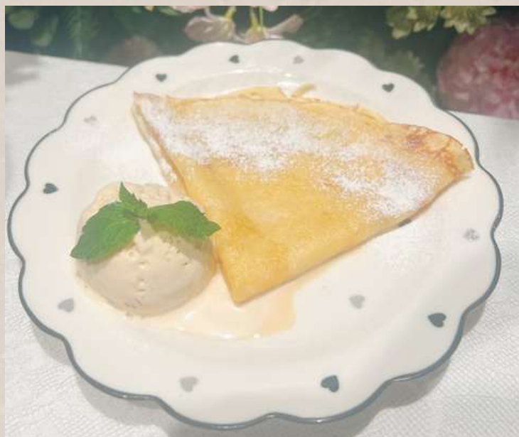
シュガーバタークレープ (塩キャラメルアイス)