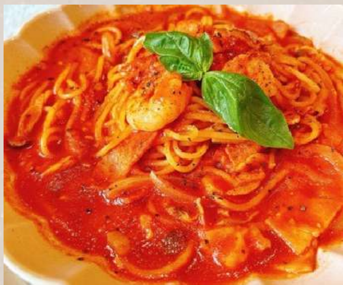
えびとあさりとベーコンのトマト スープパスタ 🌶🌶🌶