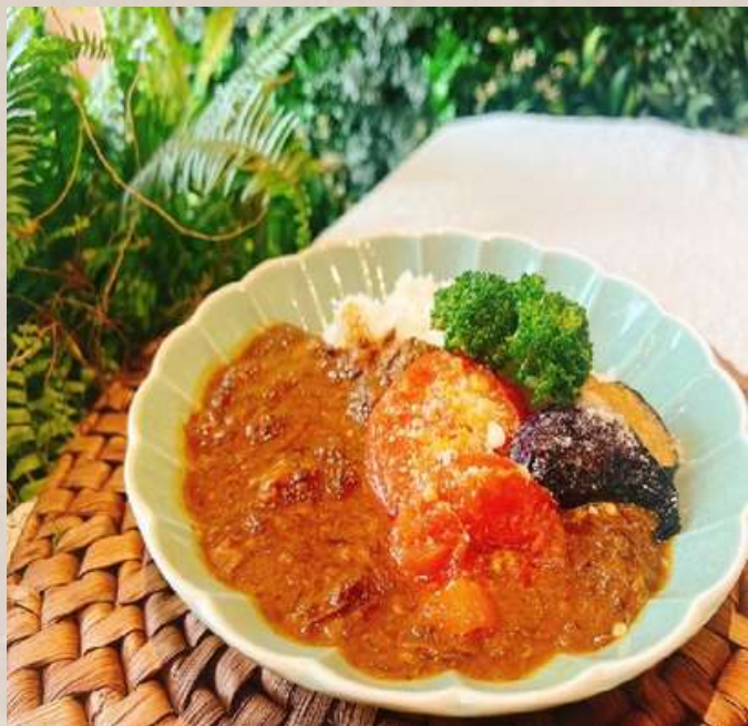
和牛100%ビーフカレー 彩り野菜