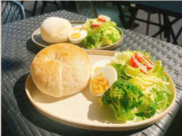
モーニングセット