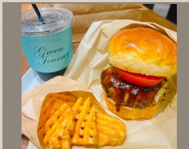
クラフトチーズバーガー ポテト・ドリンク付き