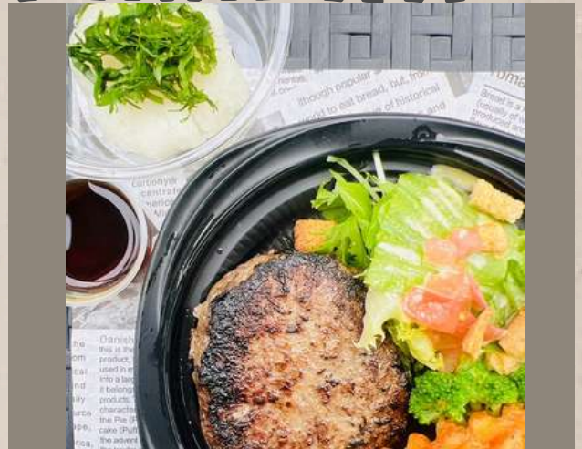
和風ハンバーグ (ライス別) ￥1000