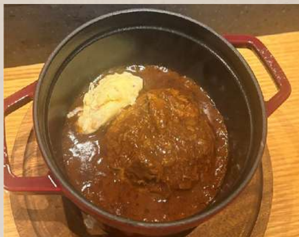
和牛 煮込みハンバーグ ¥2100