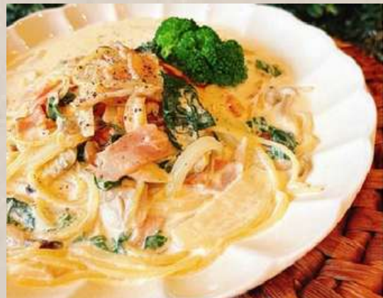
10食限定 ブロッコリーとシーフード のクリームパスタ