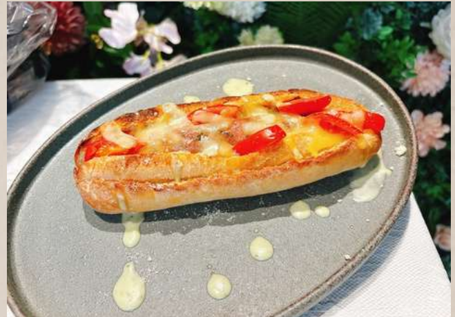
ソーセージサンドセット