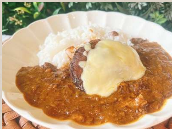
和牛100%ビーフカレーセット チーズハンバーグ ¥1850