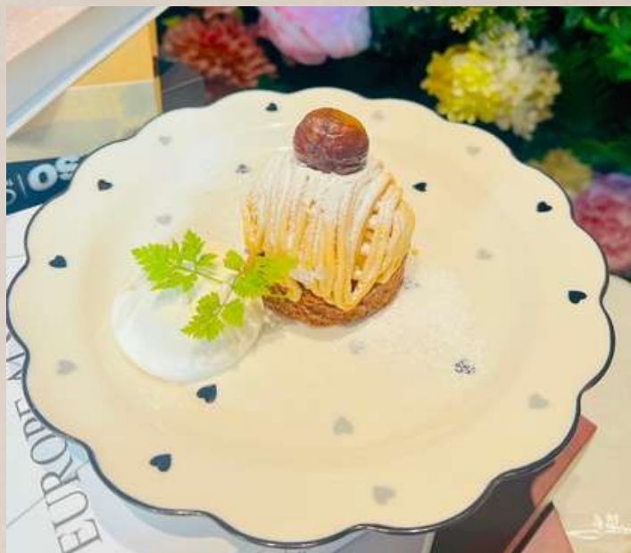
季節のデザート ¥600 ※スタッフまでお尋ねください