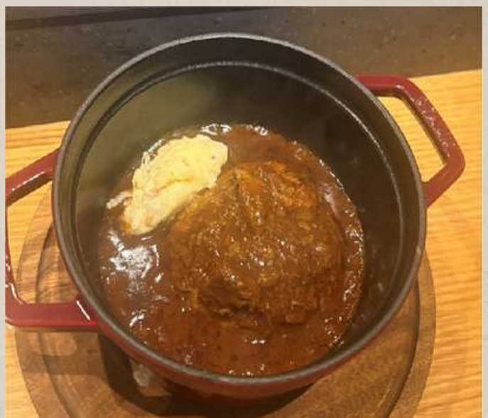
和牛 煮込みハンバーグ ライス付き