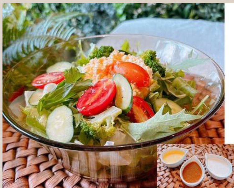
グリーンサラダ 和風・シーザー・とうもろこしから ドレッシングをお選びください) ￥1000