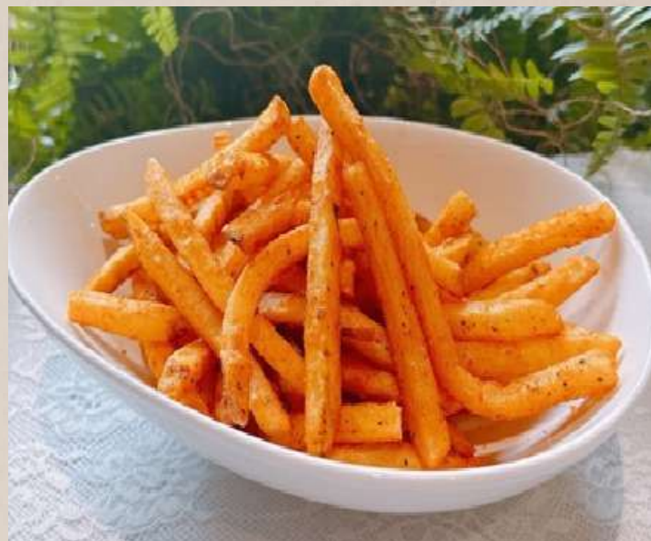
ケイジャンスパイスポテト