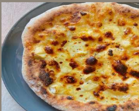
クアトロフォルマッジオ