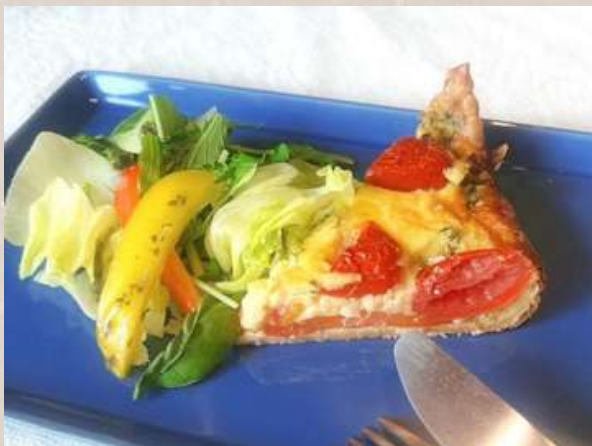
モーニングキッシュプレートセット