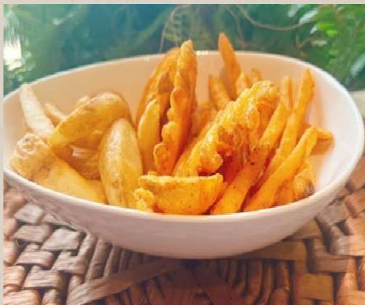
ポテト3種 盛り合わせ ¥800