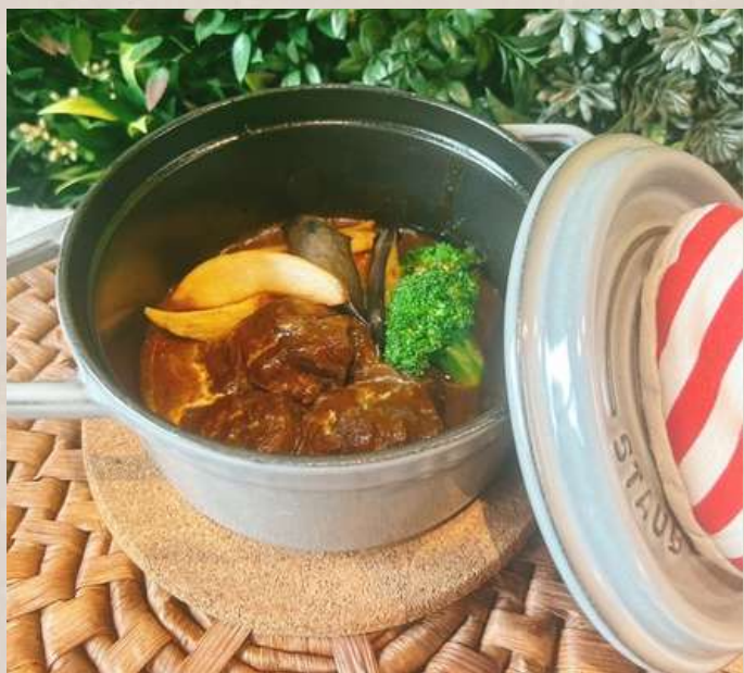
ほろほろ肉のビーフシチュー パン付き