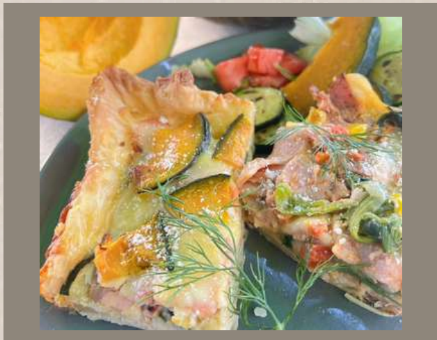
季節野菜のキッシュ ￥550