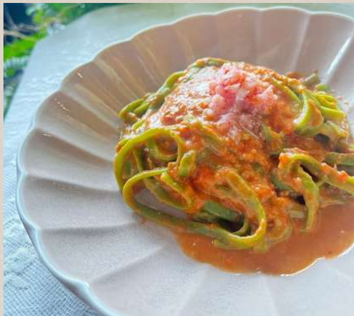
ほうれん草フェットチーネを 使用した蟹のクリームパスタ ￥1400