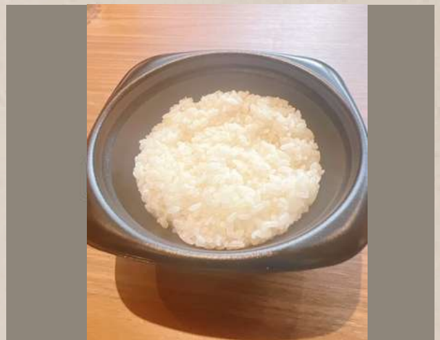
クラフトチーズバーガー ポテト・ドリンク付き ￥1400