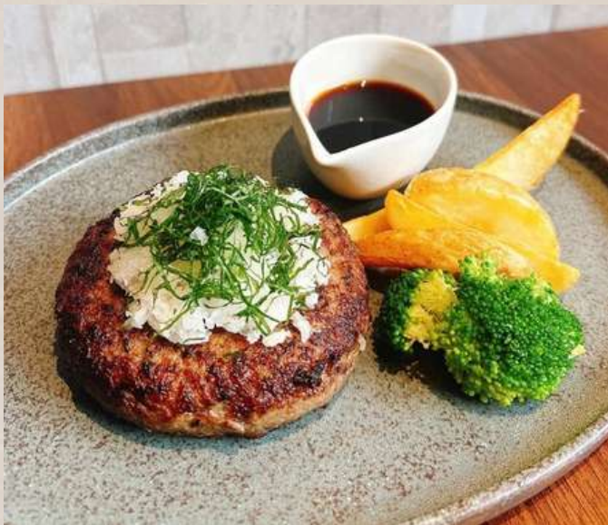
和牛100% ハンバーグ ライス付き (和風・デミグラスからお選びください)