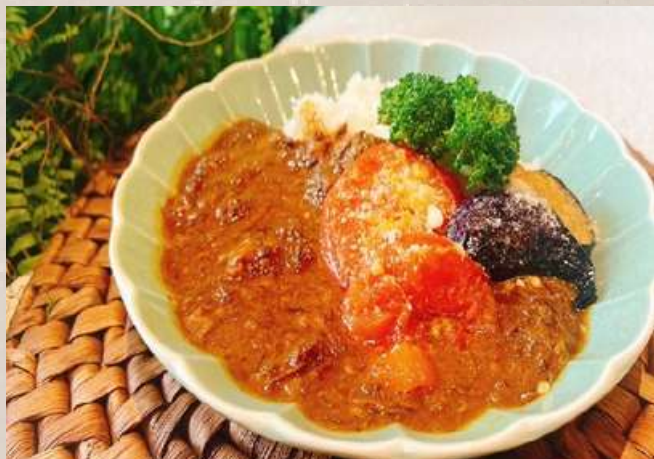
和牛100%ビーフカレーセット 彩り野菜 ¥1750

サラダ小鉢を追加の際は、和風・シーザー・とうもろこしからドレッシングをお選びください