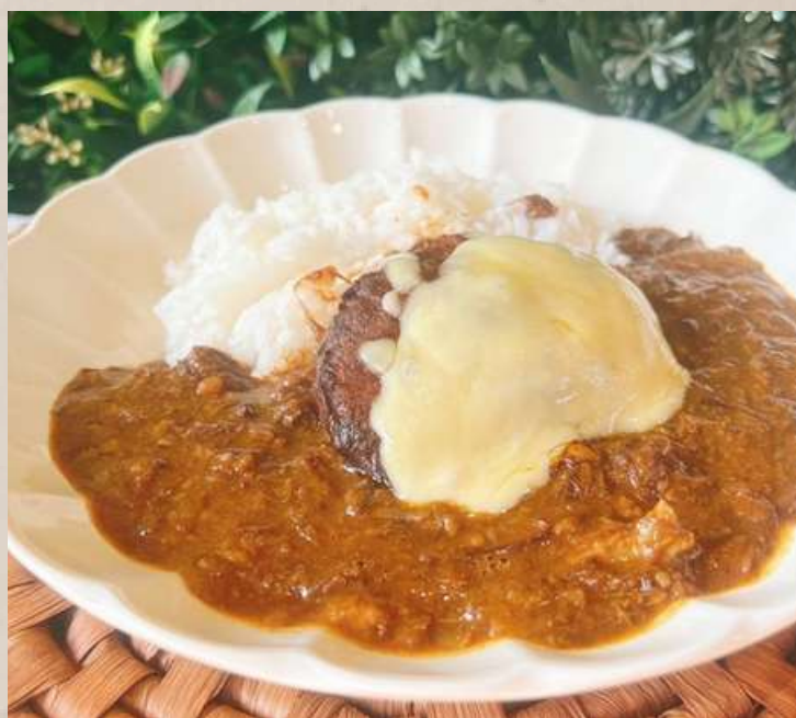
和牛100%ビーフカレー チーズハハンバーグ