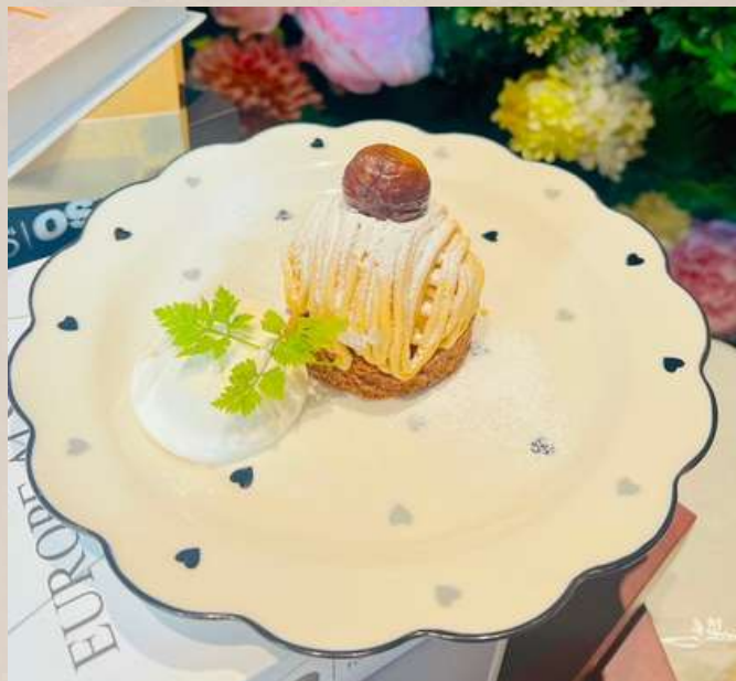
季節のデザート ¥900 ※スタッフまでお尋ねください