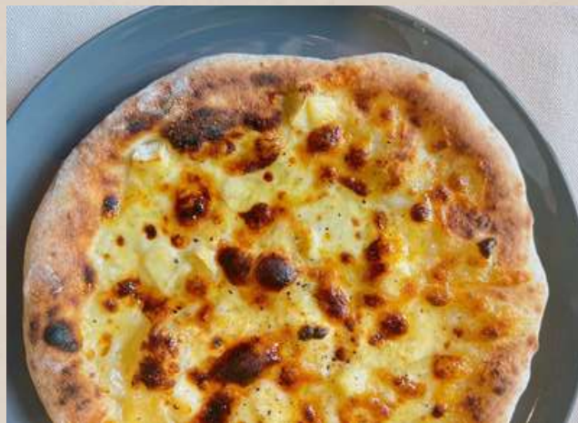
クアトロフォルマッジオ

(モッツアレラ・ナチュラルチーズ・クリームチーズ ・パルメジャーノレッジャーノ)