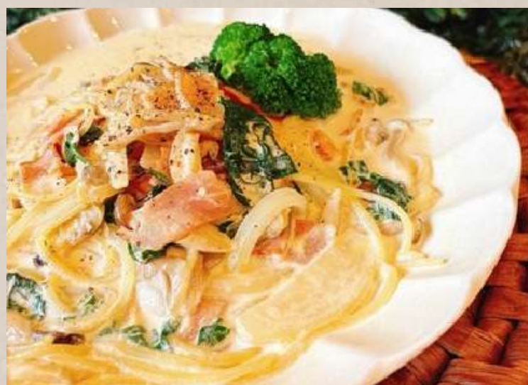
ブロッコリーとシーフードの クリームパスタ