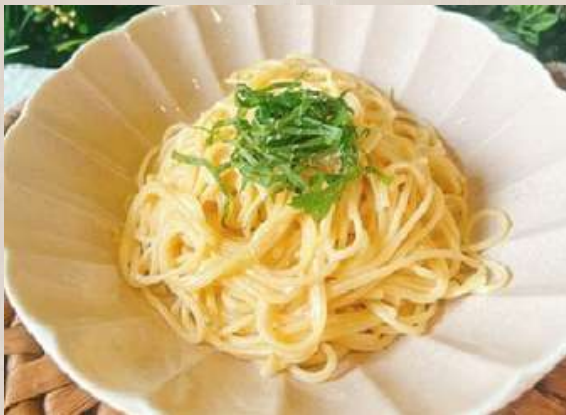
たらこスパゲティ