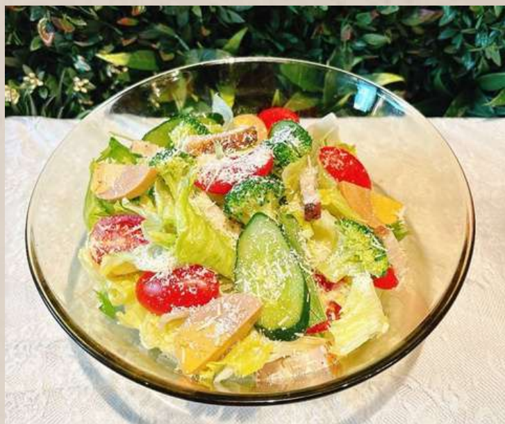
燻製たまごのシーザーサラダ ￥1300