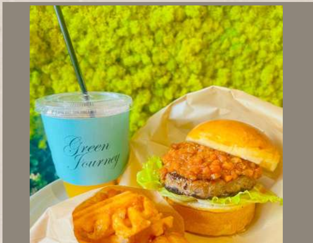
クラフトバーガー ポテト・ドリンク付き