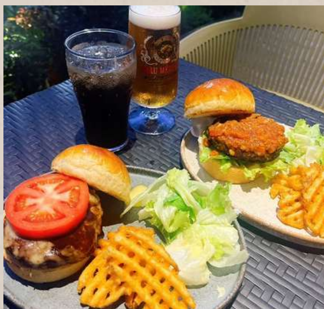
クラフトバーガー