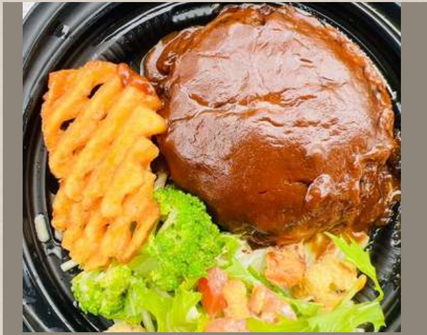
デミグラスハンバーグ (ライス別) ￥1000