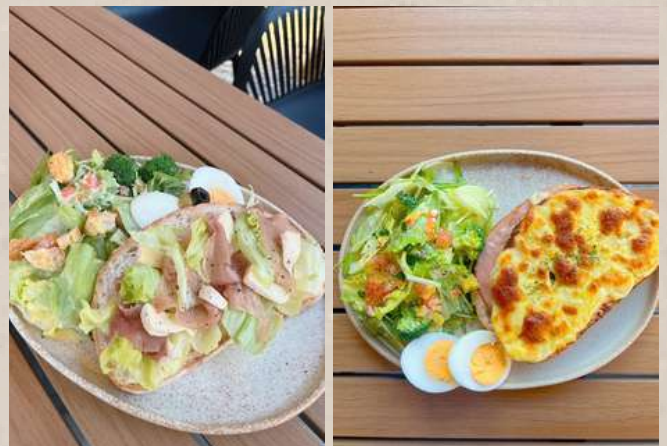
カンパーニュサンドセット