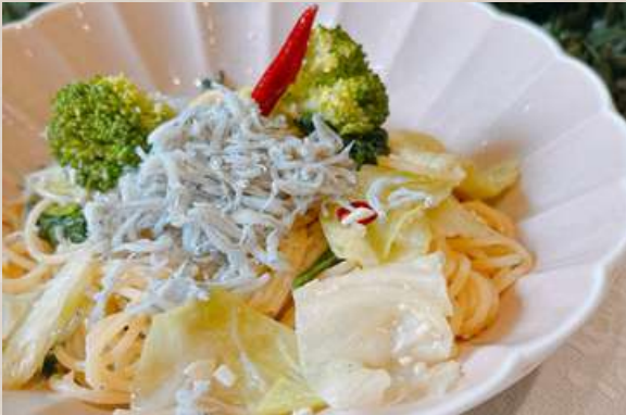
しらすとキャベツのペペロンチーノ

+300円 サラダ小鉢・+300円 アイスcream・+350円 コーヒーゼリー・+500円 ミニシュガークレープ ドリンクはタンブラー交換制になります。 サラダ小鉢を追加の際は、和風・シーザー・とうもろこしからドレッシングをお選びください