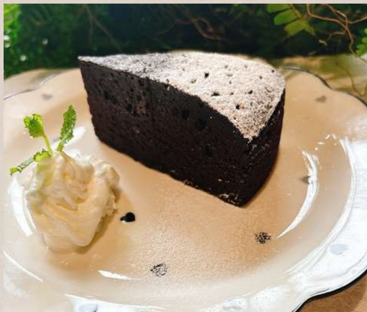
ガトーショコラ ¥950 (生クリームとコーヒークリーム)