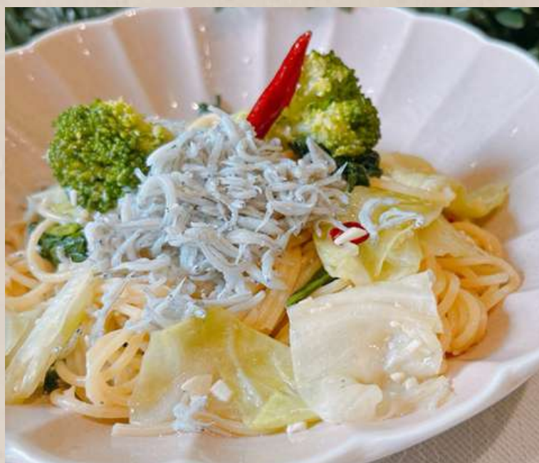
しらすとキャベツのペペロンチーノ ￥1200