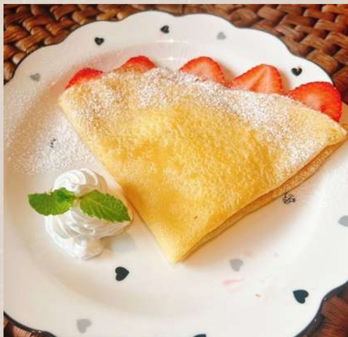
いちごのクレープ ¥1100