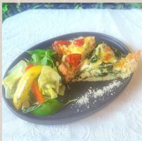
キッシュランチセット

+300円 サラダ小鉢・+300円 アイスクリーム・+350円 コーヒーゼリー・+500円 ミニシュガークレープ ドリンクはタンブラー交換制になります。