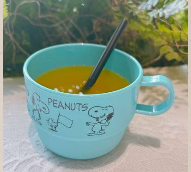
キッズドリンク飲み放題