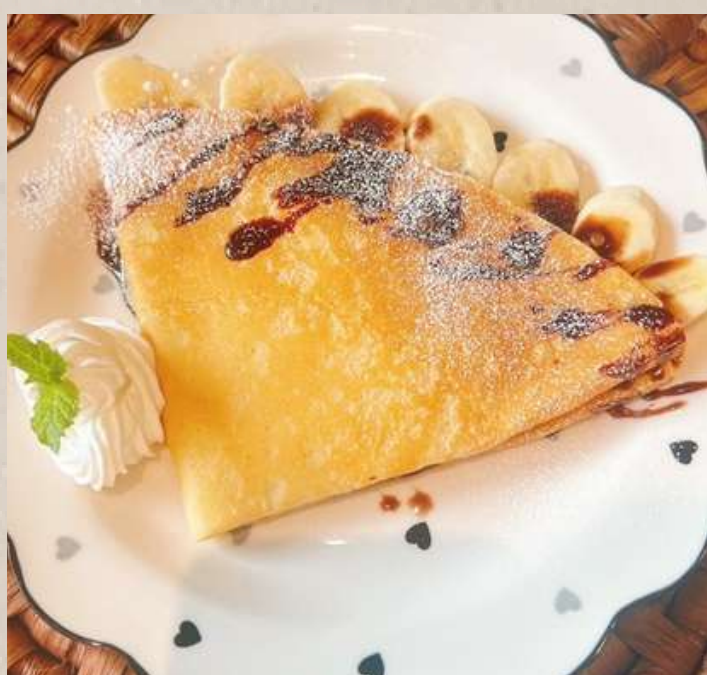
チョコバナナクレープ ¥1100