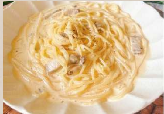
燻製ベーコンのカルボナーラ