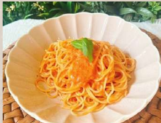
蟹のトマトクリームパスタ