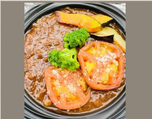
ビーフカレー (ライス別) ￥1300