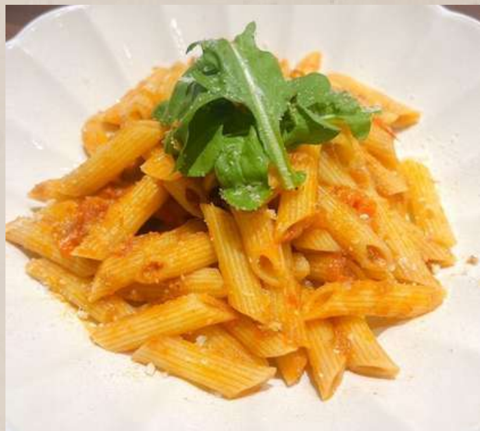
ボロネーゼペンネ